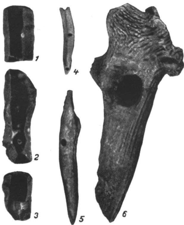
Fig. 6. — Trușești-Țuguia: 1—3, unelte din silex (circa 5/7 m. nat.) 4; colț de mistreț; 5—6, unelte și obiecte din corn (circa 1/2 m. nat.) din faza Cucuteni A.

Locul la « Capac » se află la NV de Țuguia, la circa 2 km sud de marginea satului Trușești și la aproximativ 500 m de punctul Țintirim, fiind situat între șoseaua Măscăteni-Trușești și apa Jijiei, pe un martor de eroziune din terasa inferioară a Jijiei. Pantele de nord-est și sud ale acestui martor sînt foarte line avînd la capete cîte o prelungire paralelă cu șoseaua. Panta de vest este abruptă și înaltă cu circa 8 m deasupra apei.