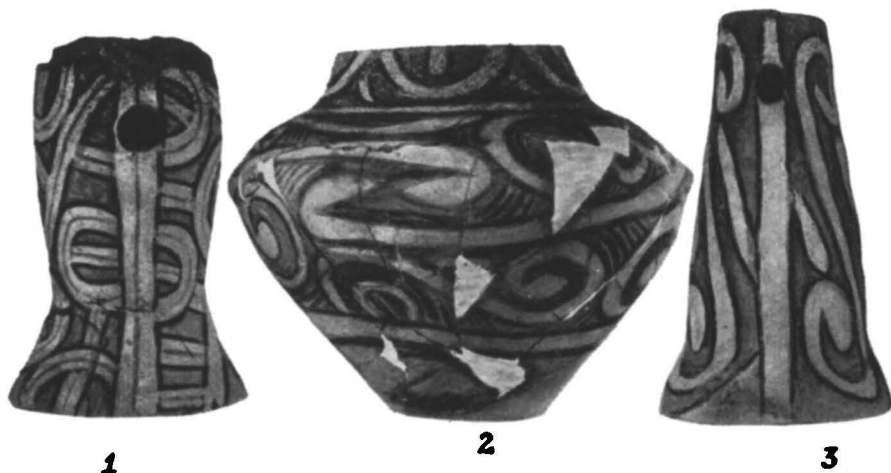
Fig. 3. — Trușești-Tuguieța. Vase Cucuteni A pictate tricrom. (1–3, circa 1/3 m. nat; 2, circa 1/5 m. nat.).

cimea, de la suprafața actuală a solului, între 1,75 și 3,40 m. Profilul este în general foarte neregulat și asimetric, în unele cazuri prezentând chiar cotloane accentuate. Acest fapt ar fi un indiciu că scopul inițial care a determinat săparea gropilor a fost acela de a scoate lutul necesar construirii locuințelor. Pământul de umplutură, în majoritatea cazurilor, îl constituie un sol de culoare brună sau gălbuie, conținând o mare cantitate