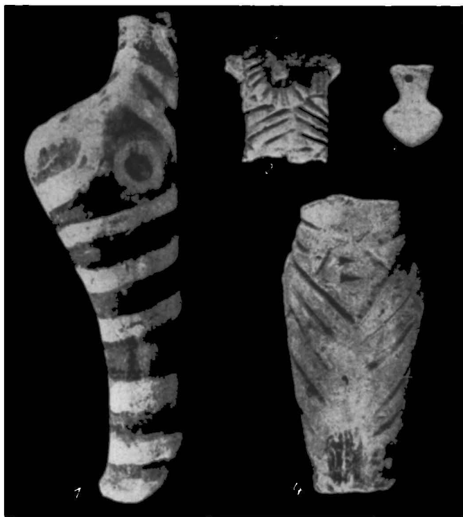
Fig. 5. - Trușești-Țuguieța. Idoli din lut ars din faza Cucuteni A (circa 5/7 m. nat.).

În comparație cu gropile Cucuteni A, groapa din faza Cucuteni B a avut un inventar destul de sărac. De aici provine însă un brăzdar (?) de plug din corn de cerb (fig. 7), unealtă necunoscută pînă în prezent în inventarul așezărilor cucuteniene din Moldova.