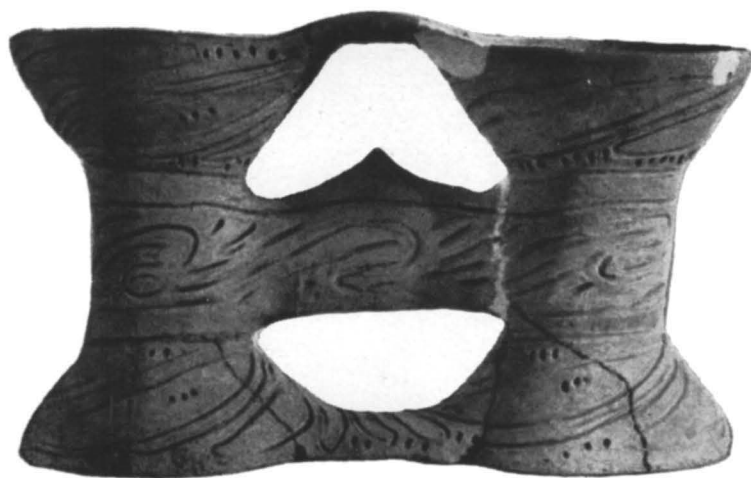
Fig. 4. - Trușești-Țuguieța. Vas binoclu cu decor adîncit din faza Cucuteni A (circa 1/3 m. nat.).

Gropile Cucuteni A, exceptînd una singură, conțin în umplutura lor un foarte